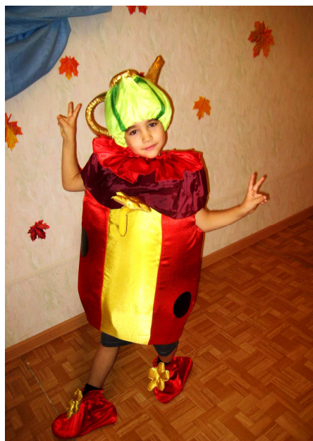
На лесной полянке